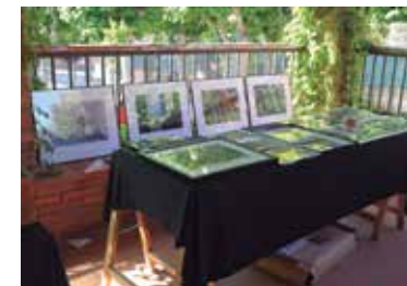
Fotografies de Miquel Abat