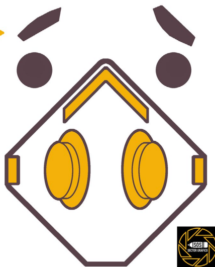
Viñeta de Olga Carmona

3 DE CADA 4 VAMOS DE CABEZA HACIA LA PRECARIEDAD O ESTAREMOS POR DEBAJO DEL UMBRAL DE LA POBREZA. #SOSSECTORGRÁFICO